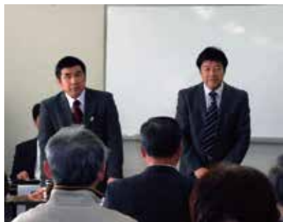
税務署長・副署長交えての研修

確定申告期間中、木更津、君津、富津、袖ヶ浦の各市をくまなく巡回し早期提出、正しい申告のPRに努めていただきました。 皆様々にはお忙しい中ご協力いただき、誠にありがとうございました。