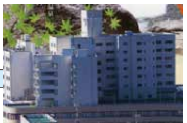
愛知県蒲郡市三谷町鷹久14-1