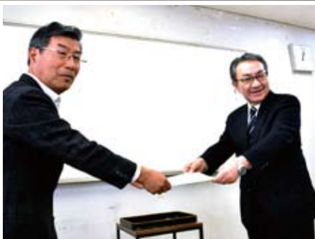
税務署長より授与された「協力要請状」