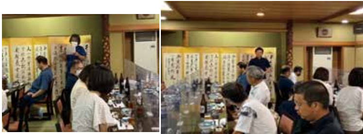
7/3 県連青年部日帰り研修会（いとや旅館にて懇親会）