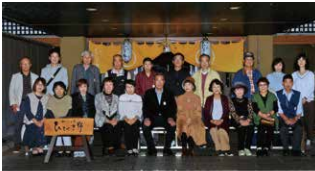
小湊鐵道赤トンボツアー 木更津青色申告会 於 伊香保温泉 10月17日