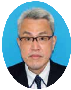
木更津税務署 署長 森重 良二

令和5年の年頭に当たり、木更津青色申告会の皆様に謹んで新年のお慶びを申し上げます。旧年中は、役員並びに会員の皆様方には、税務行政に対しまして、深いご理解と格別のご協力を賜り、厚く御礼申し上げます。昨年を振り返りますと、貴会におかれましては、記帳指導を