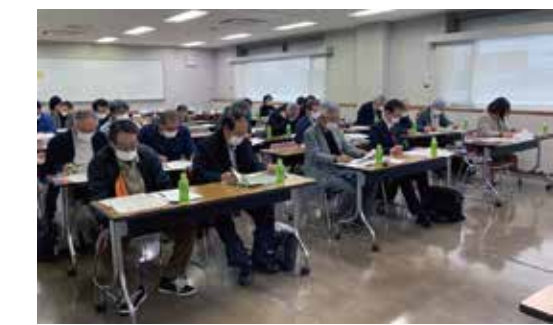
真剣に耳を傾ける従事者の皆さん