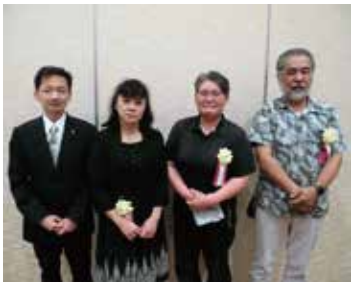
板垣会長と受賞者の皆さん